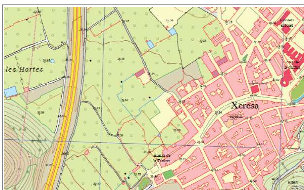
Figura 3: Serie cartográfica 1:5.000