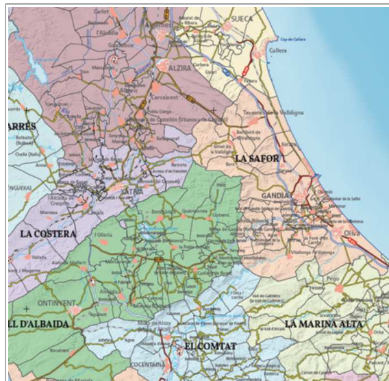
Figura 5: Serie cartográfica 1:300.000. Mapa de comarcas